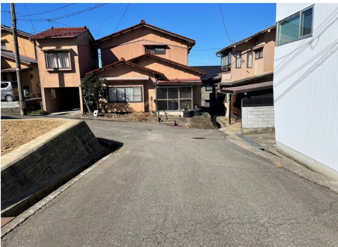
北東公道 幅員約7.0m 間口11.0m