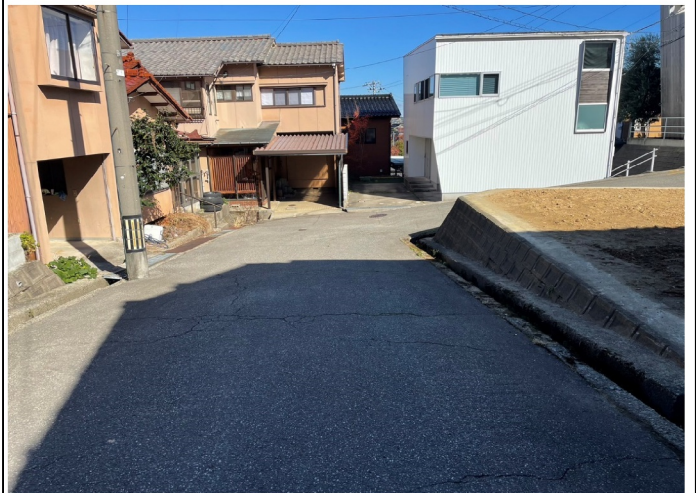
北西公道 幅員約6.5m 間口10.0m